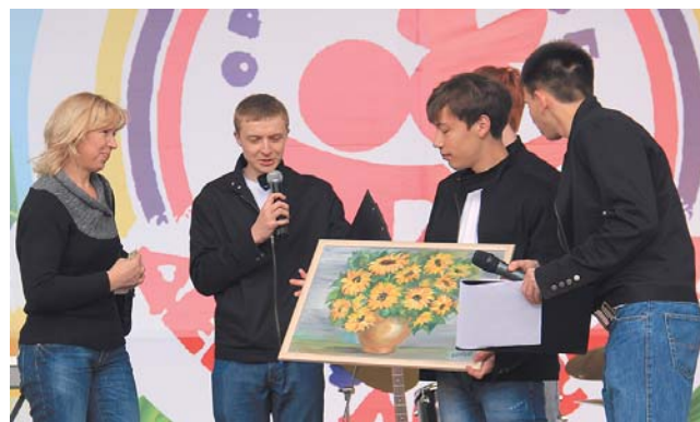
Дари добро вместе с нами! – 3 стр.