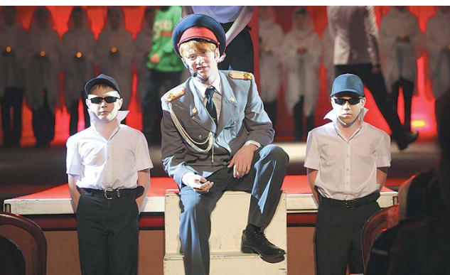
Триумф на взрослой сцене – 2 стр.

Сегодня мы напомним лишь о некоторых событиях и фактах, выводящих Оренбургское президентское далеко за орбиту обычного учебного учреждения.