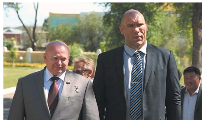
В гостях – Герой и Чемпион – 4 стр.